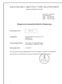
◀ Bildnummer 31s90403: Deckblatt der Zulassung Z-30.3-19