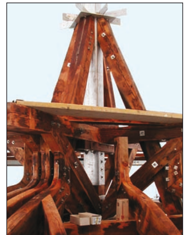
▲ Bild 31c90417: Traditionelle Holz-Bauweise mit moderner Befestigungstechnik aus Edelstahl. Mit Lean Duplex Stahl lassen sich Korrosionsschäden vermeiden und Baukosten senken.