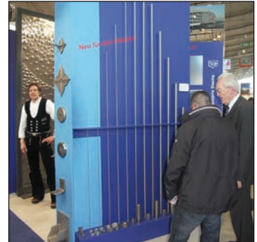
▲ Bild 31c90747: Gewindestangen bis L=3000 mm, Halteplatten und Tragkonstruktionen.

Wilhelm Modersohn GmbH & Co. KG Eggeweg 2 a 32139 Spence Telefon (05225) 87 99 0 Telefax (05225) 87 99 45 email: info@modersohn.de www.modersohn.de