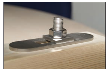
▲ Bild 31c00399: Zahnhalteanker, aufgeschraubt oder versenkt. Zähne und Langloch ermöglichen eine sichere Verstellung beim Verbinden von zwei Holzbauteilen.