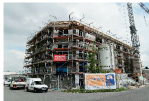
Bild 1: Der Neubau in der Bauphase an der Industriestraße in Spenge

den örtlichen Behörden, wäre die heutige Einweihung und der Umzug im Februar nicht möglich gewesen“, so Wilhelm Modersohn jun.